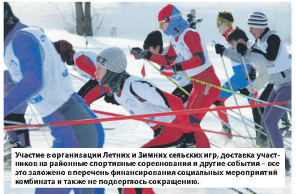
Участие в организации Летних и Зимних сельских игр, доставка участников на районные спортивные соревнования и другие события – все это заложено в перечень финансирования социальных мероприятий комбината и также не подверглось сокращению.

– Конечно, нет. Вкладывая средства в эту сферу, мы инвестируем в будущее. А на нем неэкономят. Добавлю: сохранено и все то, что связано с коллективом предприятия. Никакие сокращения не коснулись уровня заработной платы, они и не планируются, не сокращена ни одна должность, и планов таких нет. Никаких изменений нет и не будет в отношении количества